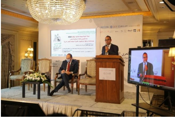
الشكل 10: أحمد حلمي، البيانات المكانية القومية البنية التحتية (موندل الأمم المتحدة، 2021).

المتحدثون: ديف ستاو، Ordnance Survey؛ نعيمة الحوسني، الإمارات العربية المتحدة؛ كارل شتايننتس، Harvard GSD؛ منال منديل، جامعة الإسكندرية