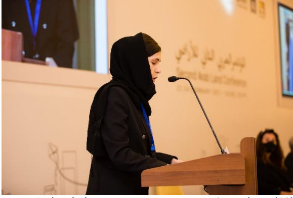
الشكل 2: السيدة/ شيلان عارف حمه-نائب وزير العدل بإقليم كردستان العراق، (برنامج الأمم المتحدة للمستوطنات البشرية (الموئل) (UN-Habitat)، 2021)

وتضمنت الجلسات الفنية مواضيع مثل التقنيات والحلول الذكية لإدارة الأراضي، ودور القطاع الخاص في إدارة الأراضي، والأدوات والممارسات للاستخدام الفعال للأراضي والتسجيل الفعال للأراضي والممتلكات، إلخ.. ووافق المشاركون على أن مساهمة كلاً من القطاع الخاص وكذلك مجتمع الأعمال في جميع مجالات التنمية يُعد أمر حاسم لتحقيق أهداف التنمية المستدامة.