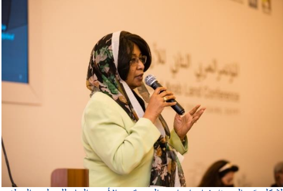
الشكل 6: السيدة/ فداء إبراهيم الدسوقي، الأمين العام للمجلس الوطني للتنمية الحضرية والتخطيط في السودان (برنامج الأمم المتحدة للمستوطنات البشرية (الموئل) (UN-Habitat)، 2021)