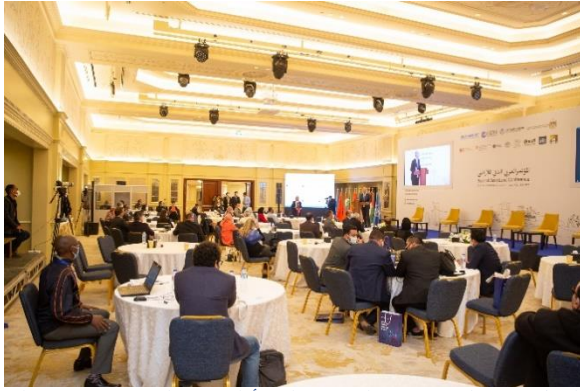
الشكل 17: الملاحظات الختامية التي أدلى بها الدكتور عرفان علي مدير المكتب الإقليمي للدول العربية، مؤنل الأمم المتحدة (مؤنل الأمم المتحدة، 2021).

الجهود التي تبذلها الدول للتصدي للأزمات الجديدة التي طال أمدها والمتصلة بالصراعات والتغير المناخي ووباء كوفيد-19.