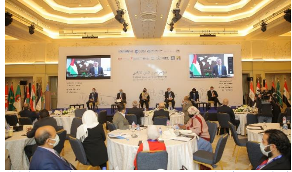
الشكل 4: معالي السيد/ محمد إبراهيم اشنتية، رئيس الوزراء، السلطة الوطنية الفلسطينية

هناك حاجة إلى مزيد من الاهتمام من حيث إدارة الأراضي لتسميات الوقف والدور الذي قد تلعبه في التنمية المستدامة. وبالمثل، فإن تعزيز حقوق المرأة في الأرض سيكون محورًا لتحقيق استقرار طويل الأمد.