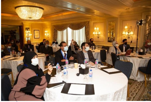
الشكل 14: المشاركون في الجلسة التقنية 5 ب حول استخدام الأراضي (برنامج الأمم المتحدة للمستوطنات البشرية، 2021).

المستوطنات البشرية على الأراضي المزروعة) ووقت السفر إلى الأسواق المحلية.