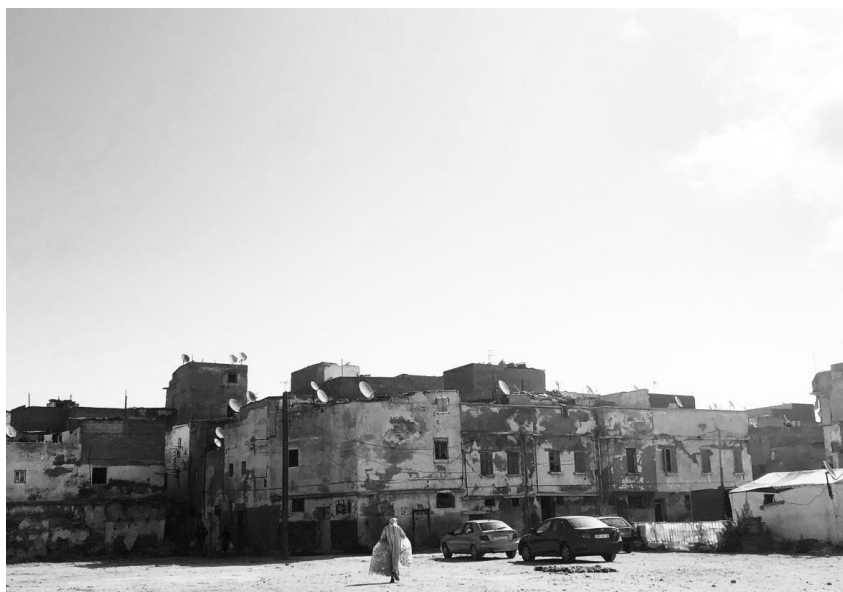
Figure 1 : Photos du site démolie de la médina extra muros – tranche prioritaire, 2019.