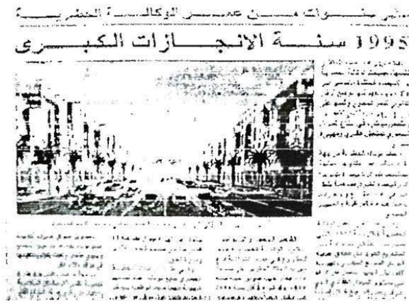
4.5.2. " Projet / plan [tasmim] de l'Avenue Royale qui relie la Mosquée Hassan II à la Place des Nations unies " (Al-Sahrā' al-maghribiyyah, 19.2.97).

Seulement 500 familles ont été recensées au départ lors des enquêtes de 1989. Cependant, un recensement plus fin de la population laisse apparaître 30 ménages supplémentaires. Pour remédier à ce surnombre, la SONADAC a elle-même procédé à la division de 30 appartements réservés aux ménages les plus petits ainsi qu'aux cas litigieux selon les critères de la Sonadac (Hauw, 2004, p. 243).