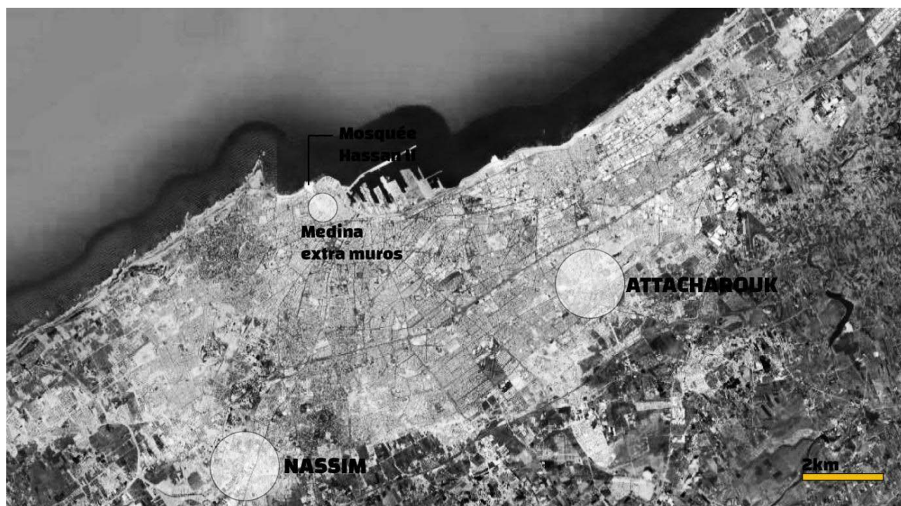
Figure V : Situation des projets de relogement Nassim et Attacharouk à Casablanca.