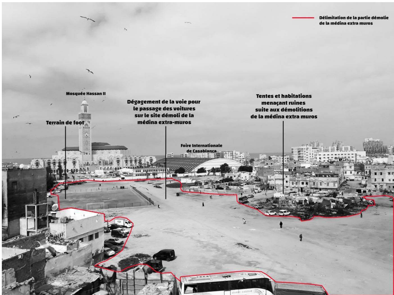
Figure VIII : Photo de l'état actuel du site étudié. On peut voir que l'espace où les habitations ont été démolies a été dégagé, en plus de l'aménagement en 2019 d'un terrain de foot pour les habitants, 2020.

Quoiqu'ayant un poids non négligeable dans le retard et blocage du projet de l'aménagement de l'Avenue royale, il est évident que la SONADAC ne peut inculquer « exclusivement » aux habitants la responsabilité de l'arrêt du projet et sa stagnation, d'autres causes liées à la mauvaise gestion du projet sont à mentionner.