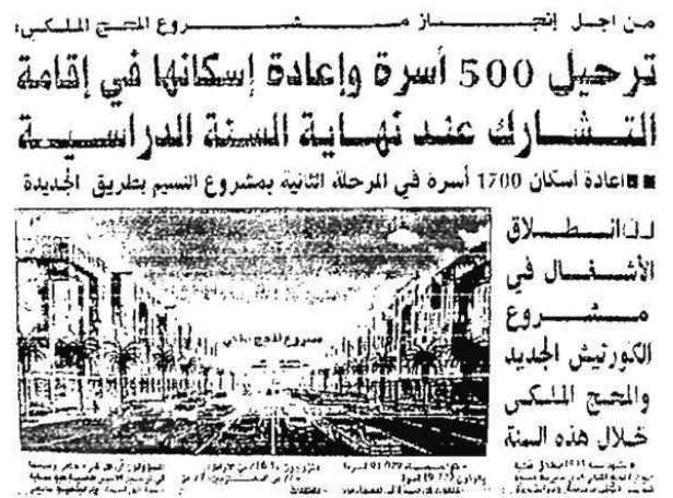
4.5.3. " Projet [machru'] de l'Avenue Royale ", Al-Alam (27.02.1995)