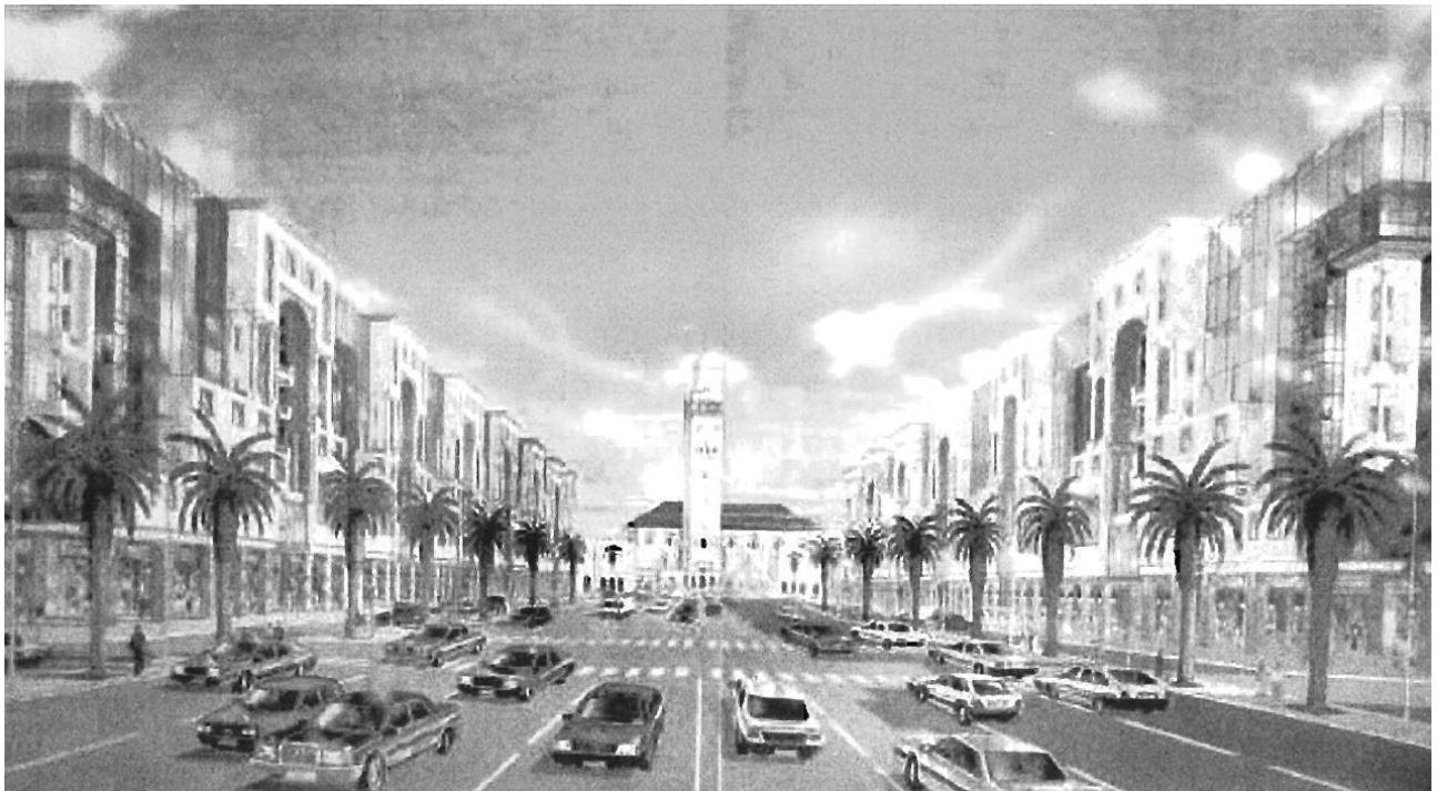
Figure II : Simulation de la future Avenue royale. Source : Basri et alii, Mosquée Hassan II (1993) dans Cattedra (2001, p : 273-274).

été l'une des zones convoitées par l'Etat pour accueillir le projet de l'Avenue royale. Son statut juridique qui est immeubles Melk, variant entre bien non titrés relevant du droit musulman (présence de zinataires, le droit de zina fait partie des droits réels coutumiers musulmans. D'après l'article 131 du code des droits réels (CDR), le droit de zina est un droit réel qui attribue à son titulaire la propriété des bâtiments qu'il a édifiés à ses propres frais sur le terrain appartenant à autrui), et biens titrés relevant du droit moderne (présence de propriétaires) permet l'expropriation pour cause d'utilité publique, d'autant plus que ce quartier est considéré comme vétuste, cette opération d'expropriation rentre dans le cadre des politiques du Maroc pour la lutte contre l'habitat insalubre. Le projet de l'Avenue royale est donc présenté, d'une part, comme une opération de rénovation urbaine qui renforcera le rayonnement international de Casablanca grâce à une action majeure de restructuration urbaine dans le centre-ville et, d'autre part, comme un projet social de « salubrité » publique permettant aux habitants de la médina extra muros d'accéder à des conditions de vie décentes dans une « ville nouvelle » (Nassim) (Navez-Bouchanine, 2012, p. 148).