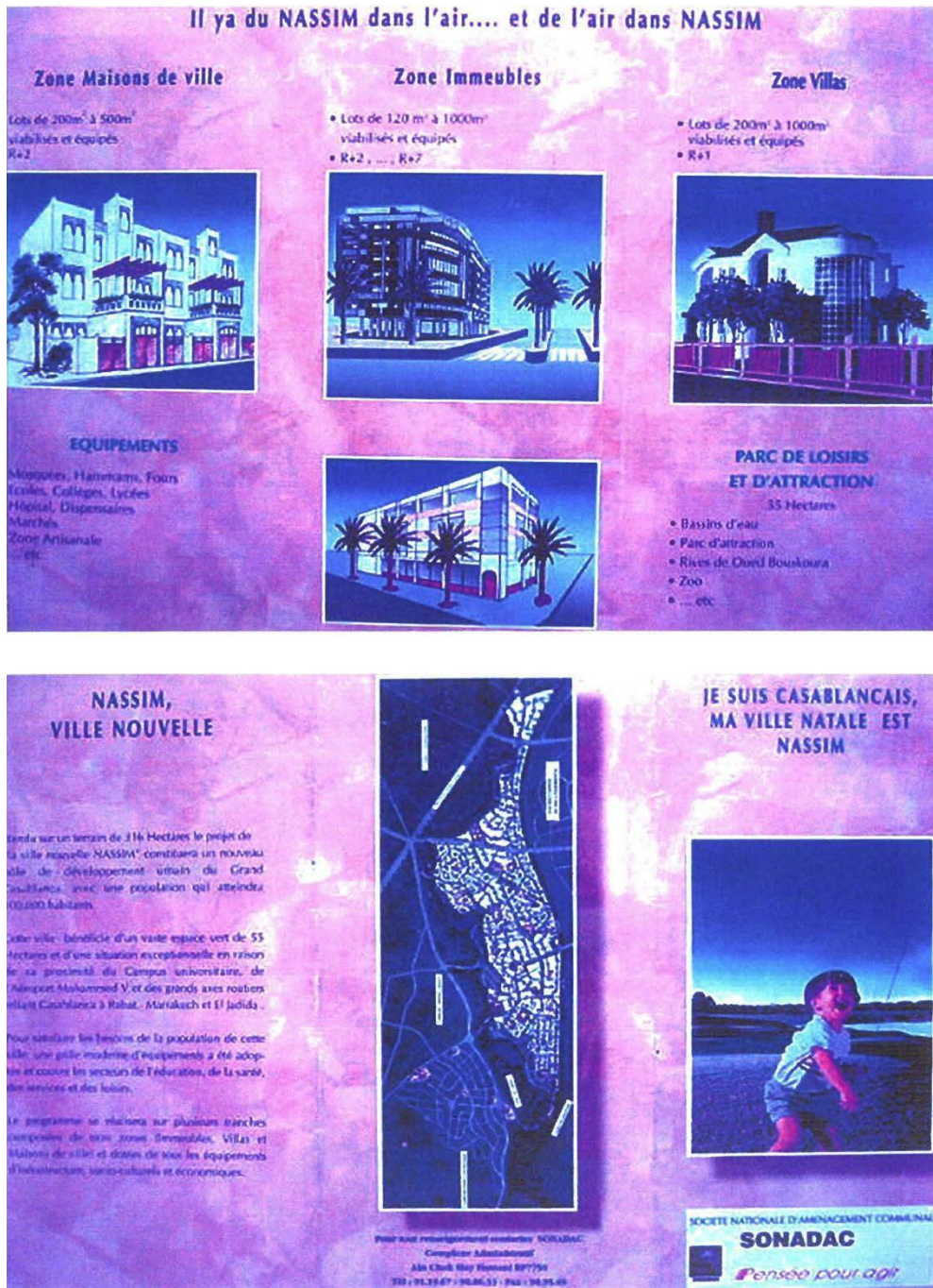
Figure VII : La publicité de la cité Nassim faite par la SONADAC recto et verso.

logements de différentes typologies, des équipements d'accompagnement et d'activités, ainsi qu'un parc de loisirs le long de l'oued Bouskoura sur une superficie de 50 ha (Le Matin, 2014). À Nassim les logements sont constitués d'une à quatre pièces avec une majorité d'appartements «trois pièces» disposant d'une superficie moyenne de 53 m 2 (Hauw, 2004, p. 296).